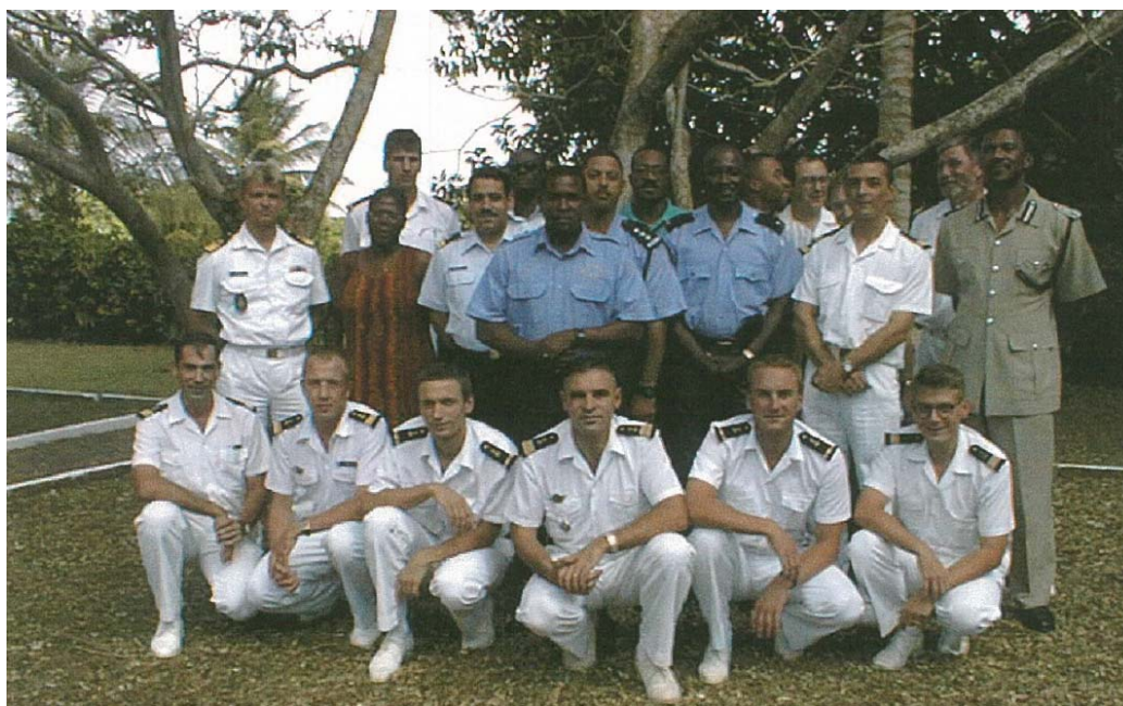
Colloque sur le sauvetage en mer à Fort-de-France, le 3 juin 1999