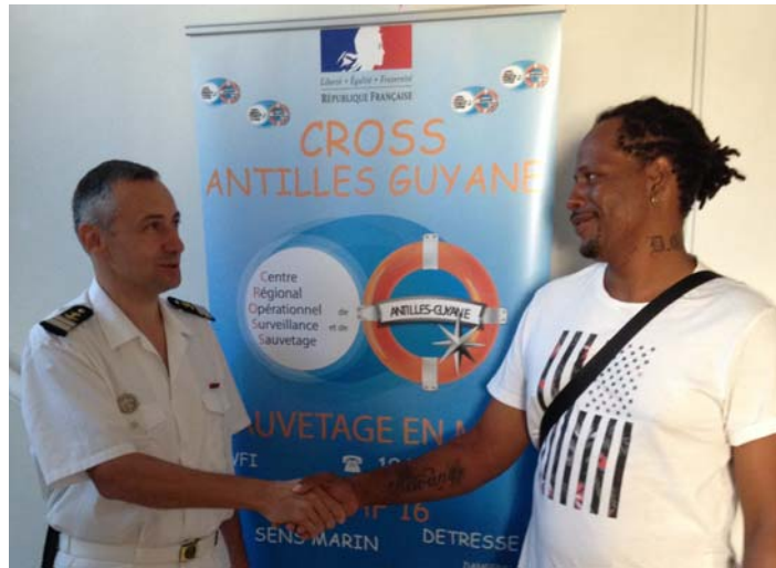
Le propriétaire du navire Armani, hélitreuillé après 24 heures de dérive en décembre 2015 est venu saluer le CROSS

Le Centre Régional Opérationnel de Surveillance et de Sauvetage Antilles – Guyane (CROSS AG) fête ses 15 ans