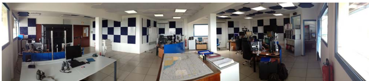
Salle opérationnelle du CROSS Antilles – Guyane (Fort-de-France), à partir de 2014