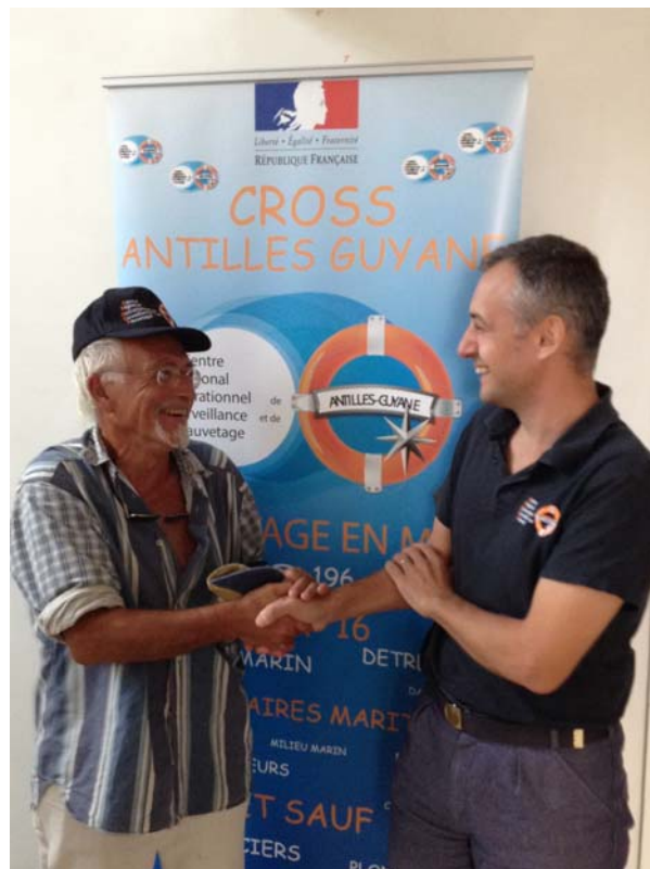
Le skipper du trimaran Jalucine 2 auquel le CROSS a porté secours lors de son naufrage en novembre 2015