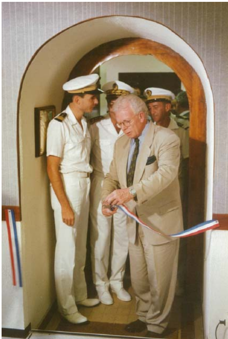
Inauguration du COSMA le 14 janvier 1993 en présence M. Charles JOSSELINE, secrétaire d'État à la Mer