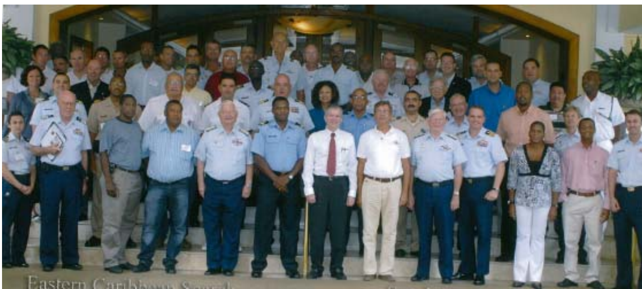
Participation du CROSS AG au colloque sur le sauvetage en mer à San Juan, Porto Rico, le 15 juillet 2008

Le Centre Régional Opérationnel de Surveillance et de Sauvetage Antilles – Guyane (CROSS AG) fête ses 15 ans